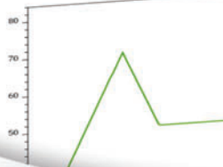
Gráfico do teste:

APP GERADOR DE TAREFAS PARA CRIAR TESTES E GERAR QR CODES CONTENDO OS DADOS.